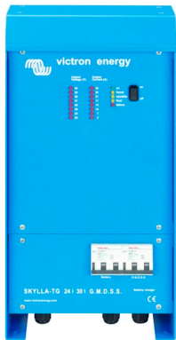
Skylla-TG 24/30 GMDSS